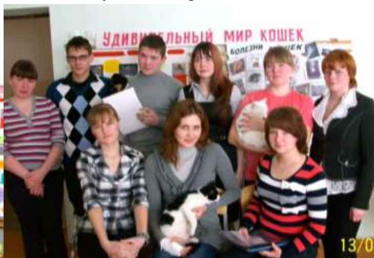
Участники выставки кошек