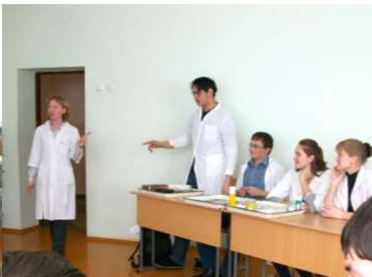
Конкурс «Лучший хирург»