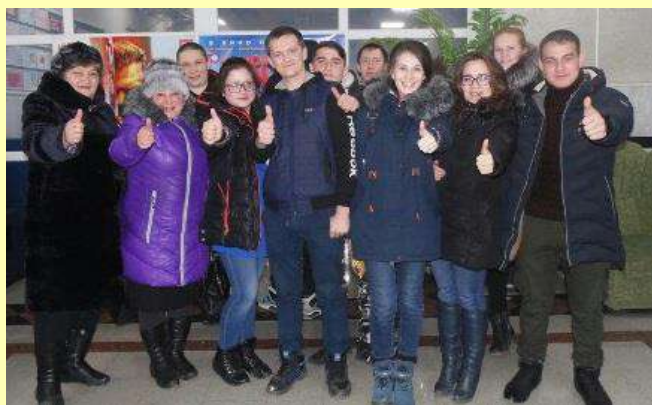
На фото: студенты – активисты общежития №2