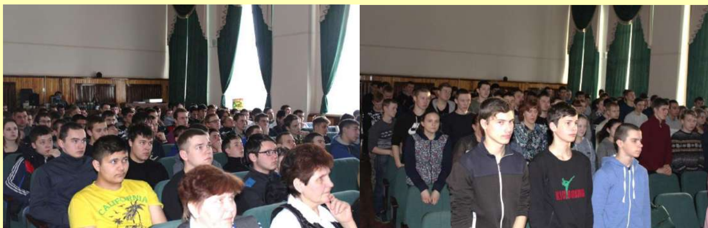
На фото: Минута молчания в память погибшим