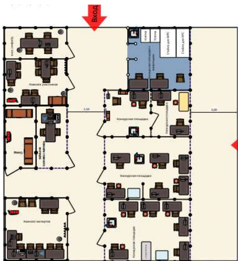
Схема конкурсной площадки (см. иллюстрацию).