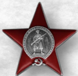
Орден Красной Звезды, 1943