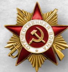
Орден Отечественной войны I степени, 1985, юбилейный