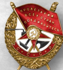
Орден Красного Знамени, 1945