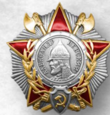
Орден Александра Невского, 1945