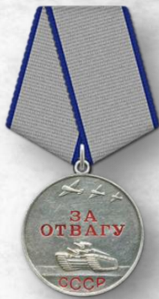
Медаль «За отвагу», 1943