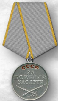
Медаль «За боевые заслуги», 1942