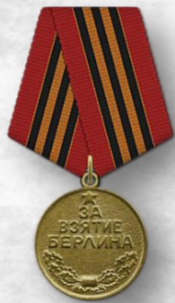
Медаль «За взятие Берлина»