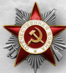
Орден Отечественной войны II степени, 1944