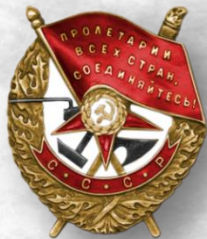
Орден Красного Знамени, 1943