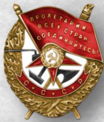
Орден Красного Знамени, 1943