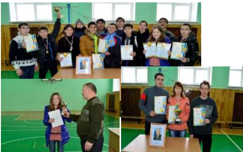
На фото: победители соревнований