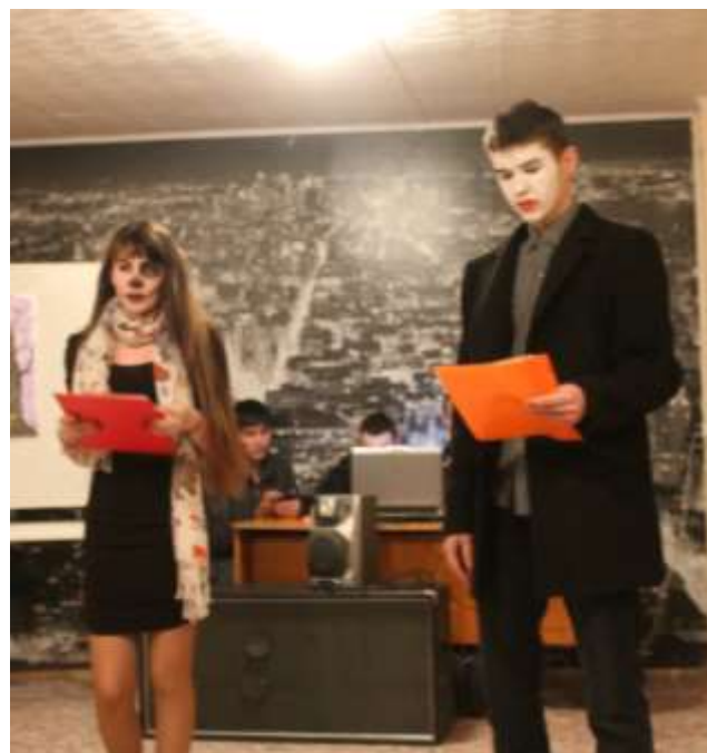
На фото: моменты праздника Хэллоуин

Если бы люди были по-настоящему смелы, они бы надевали костюмы каждый день. А не только на Хэллоуин.