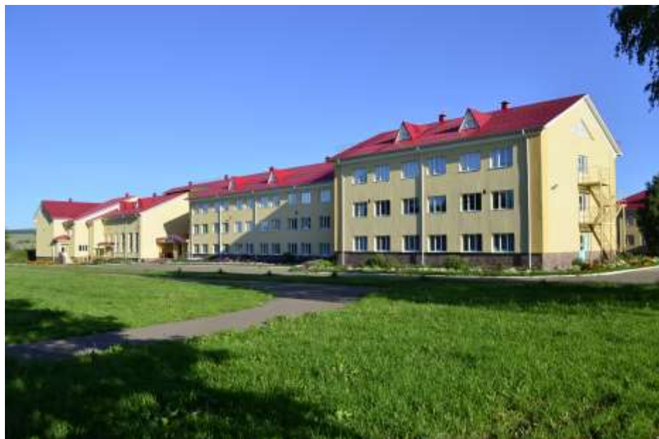
На фото: здание Дуванского аграрного техникума