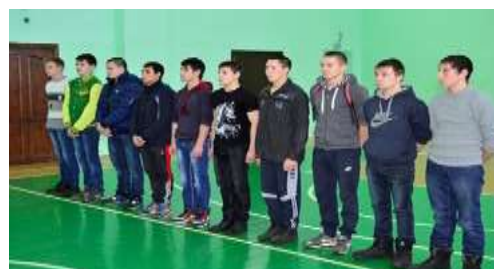
На фото: моменты соревнования

Спорт формирует культуру оптимизма, культуру бодрости.